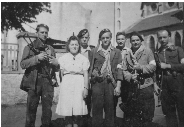
Maquisards d'Eréac après la victoire au siège du Cap Fréhel, Plévenon, août 1944

Gilles BOURRIEN est l'auteur de l'ouvrage Des Femmes et des hommes dans la résistance et le combat 1940-1945 : intersecteur-Est des Côtes-du-Nord paru en 2022.